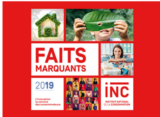
Faits marquants 2019