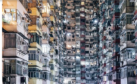
Coronavirus (Covid-19) et paiement des factures de gaz et d'électricité