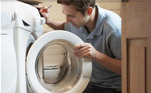
Coronavirus (Covid-19) : votre lave-linge vient de tomber en panne