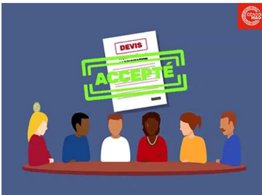
Assemblées générales de copropriétaires : participer à distance, c'est possible !