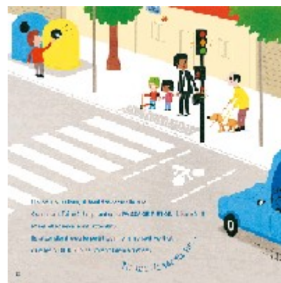
Maëva sur le chemin de l'école