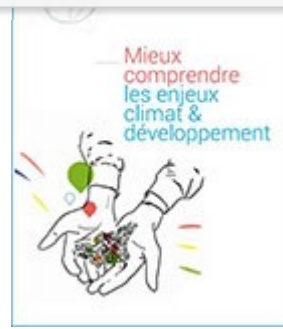
Mieux comprendre les enjeux du climat et du développement : livret de l'enseignant