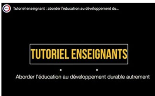
Aborder l'éducation au développement durable autrement : tutoriel enseignant