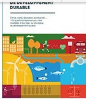
Mieux comprendre les objectifs de développement durable : quiz