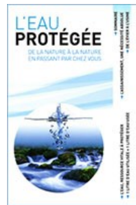
L'eau protégée, de la nature à la nature en passant par chez vous