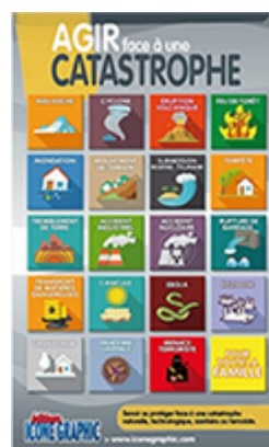
Agir face à une catastrophe