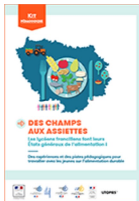
Des champs aux assiettes