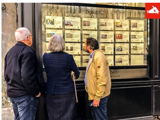
Coronavirus (Covid-19) : l'impact sur les ventes immobilières