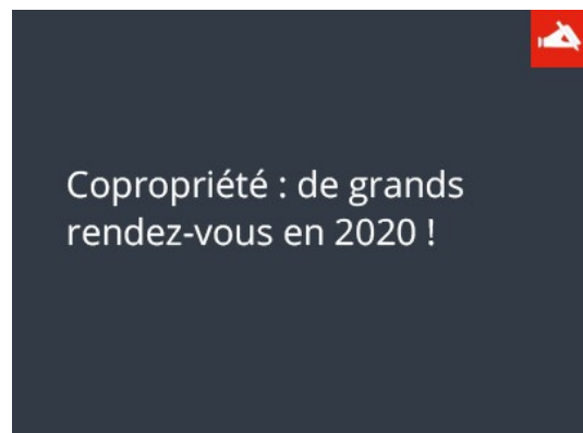
Copropriété : de grands rendez-vous en 2020 !